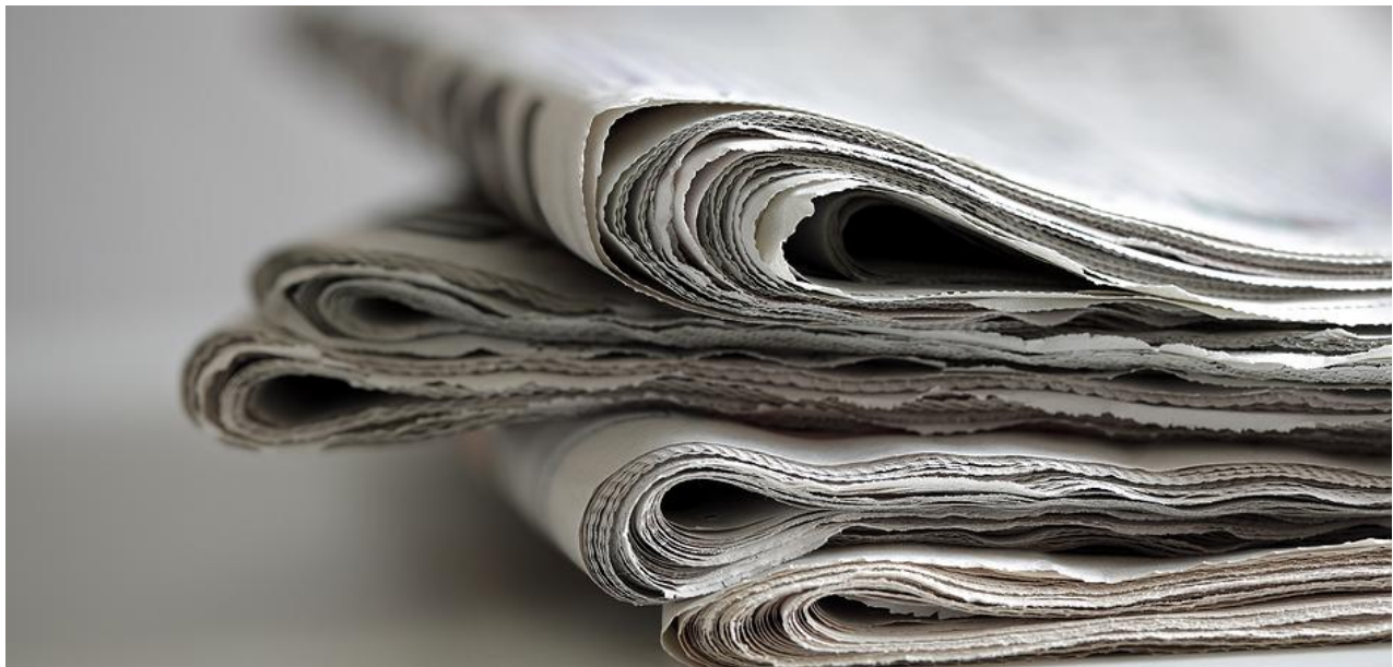
Presse: Die große Vielfalt

Ein kleiner Leserservice zum Weihnachtsfest 2009, aktualisiert im Sommer 2016